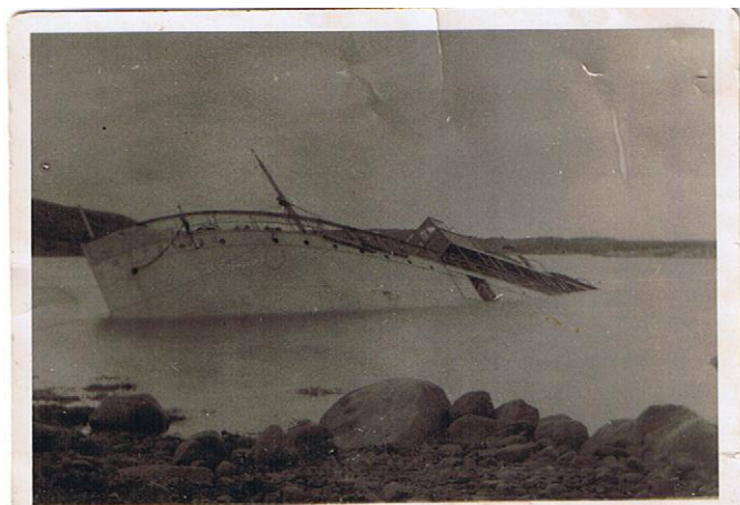
S/S GÖTEBORG liggande halvsjunken vid Ölbärn utanför Kämpersvik, hösten 1930.

S/S Göteborg skrotades år 1975 i Hälle vid Idefjorden.