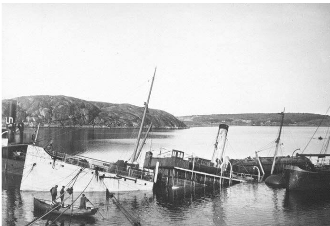
Bärgningen av S/S Göteborg vid Ölbärn . I bakgrunden ligger Stora Brattholmen och Otterön .